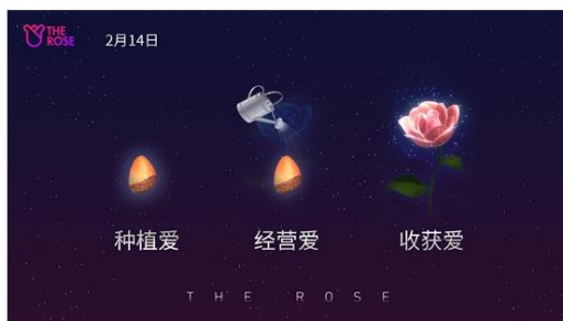
The Rose 培育过程图解

每日浇灌玫瑰能够增加POL (Proof of Love) 值，POL值越高开出的玫瑰就越美丽。每一朵玫瑰都拥有自己的身份验证，从诞生之日起玩家的每次行为（浇灌、繁殖、赠送等）均被记录在区块链上。还可记录自己的心情到玫瑰的链上，永久相传。