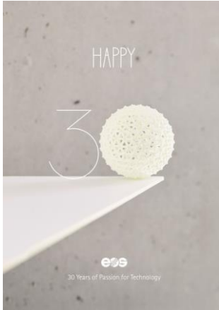
Happy 30 EOS - 폴리머.