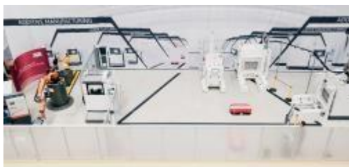
NextGenAM 파트너 프로젝트: Premium AEROTEC, Daimler 및 EOS에 의해 작동하는 자동 3D 프린팅 프로세스 셀. https://www.youtube.com/watch?v=FknsXWSM_Nc